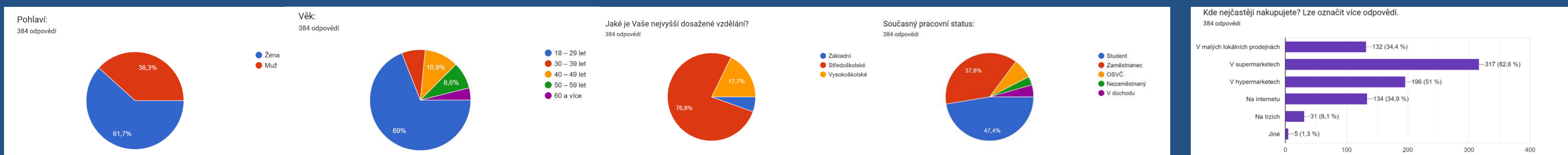
Obrázky 1 – 4: Demografické údaje.