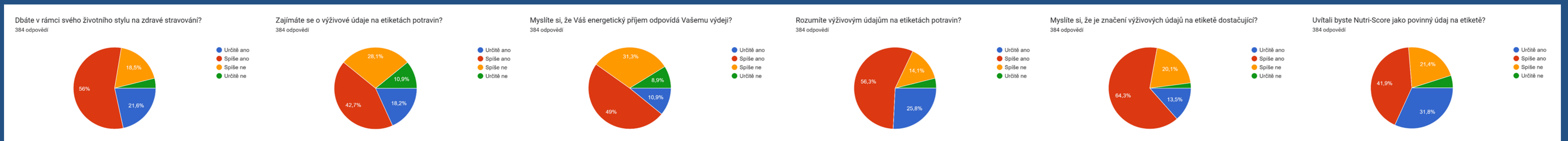
Obrázky 6 – 11: Preference respondentů v oblasti uvádění výživových údajů na etiketě výrobků a další související informace.