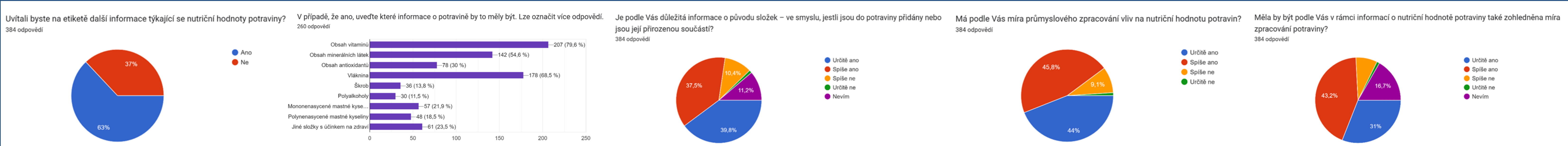
Obrázky 14 – 18: Preferované informace respondentů v rámci výživových údajů.